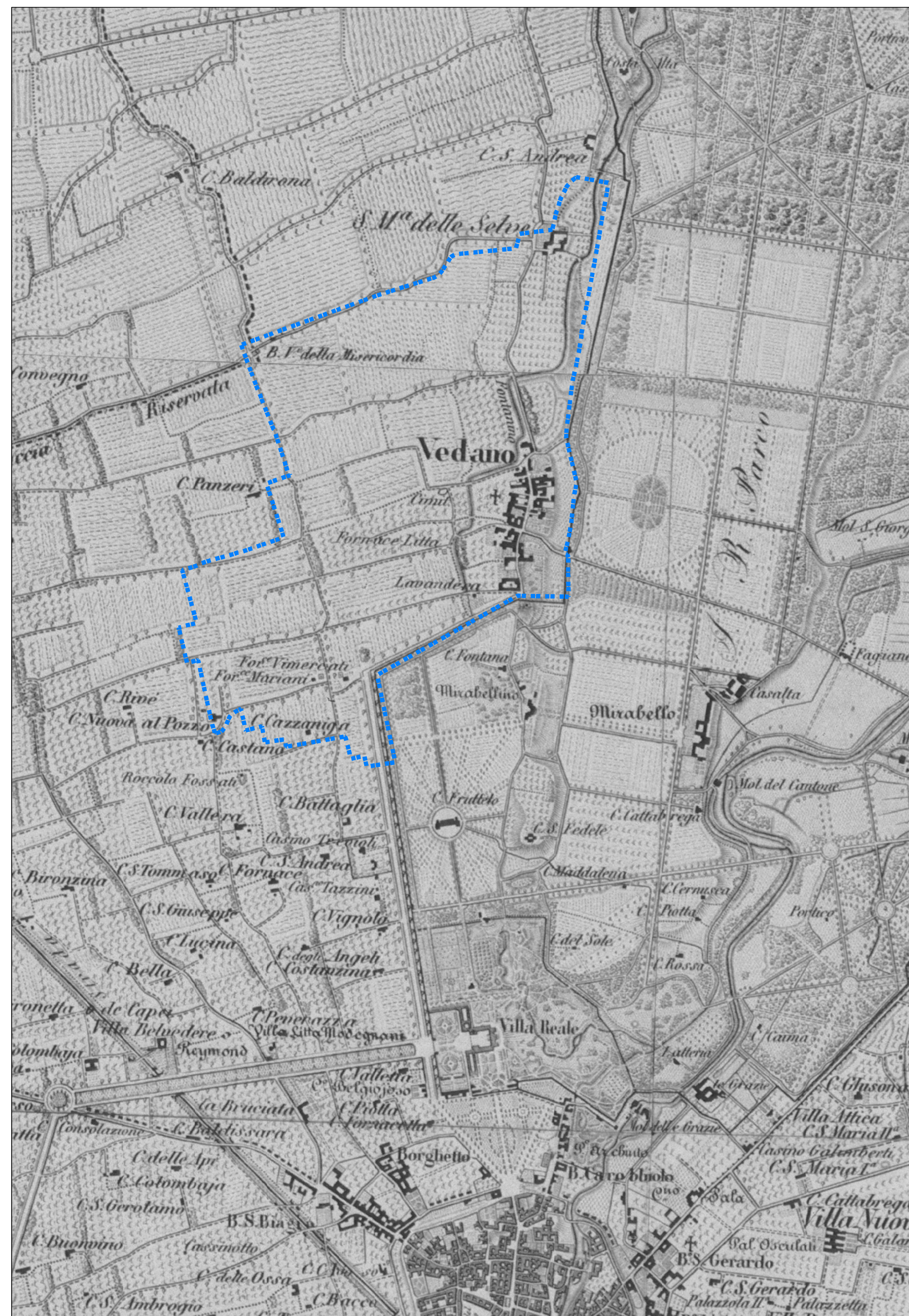
FIG.3 Mappa topografica della Reale Villa di Monza con annesso Parco, città di Monza e d'intorni. - Tenente Brenna. - Fonte: F. De Giacomi (a cura di), Il Parco Reale di Monza , Associazione Pro Monza, Milano, 1989, pag. 13