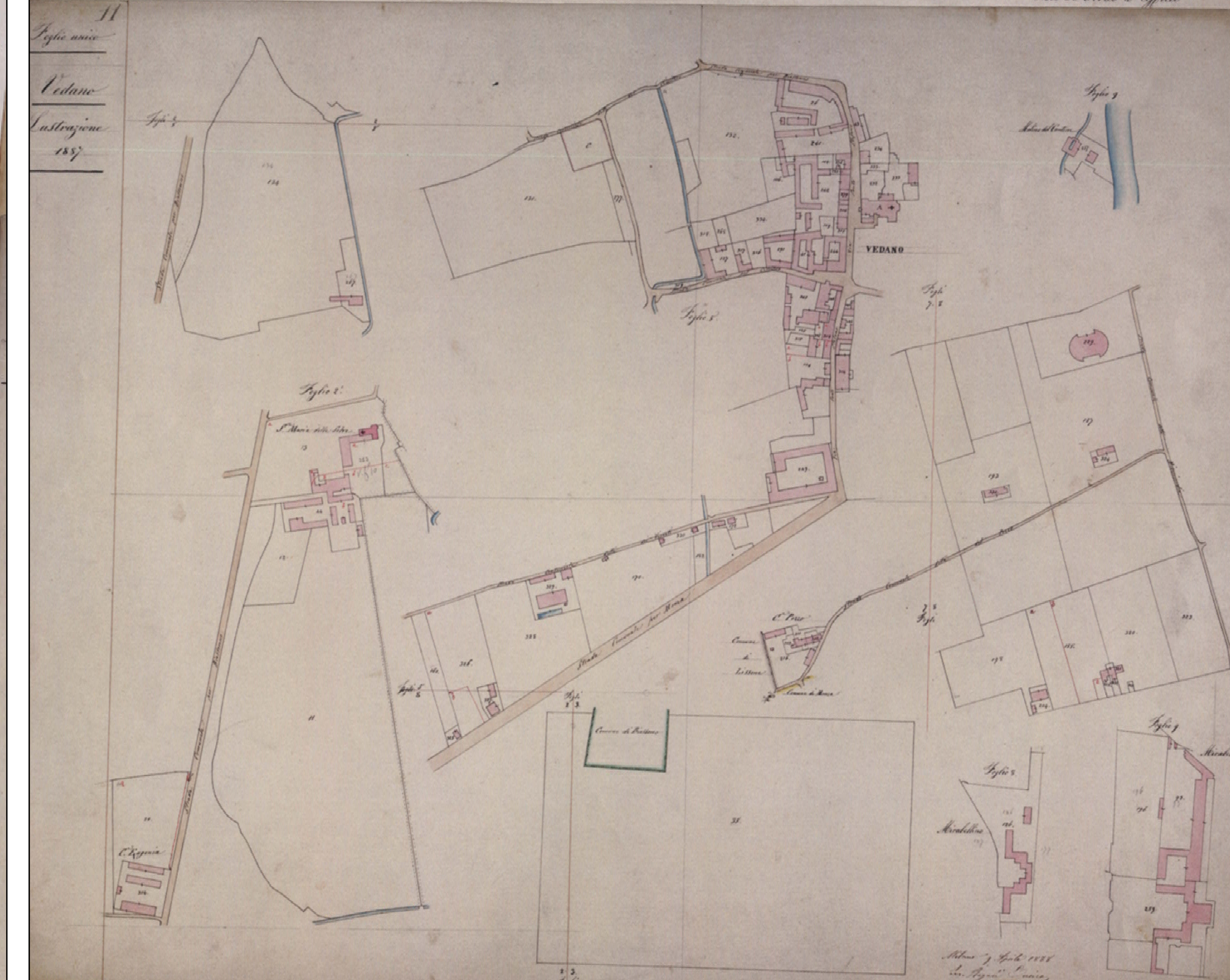
FIG. 3 Comune di Vedano al Lambro, Mappe catastali del 1855 - Foglio Unico n. 11 - Lustrazione del 1887