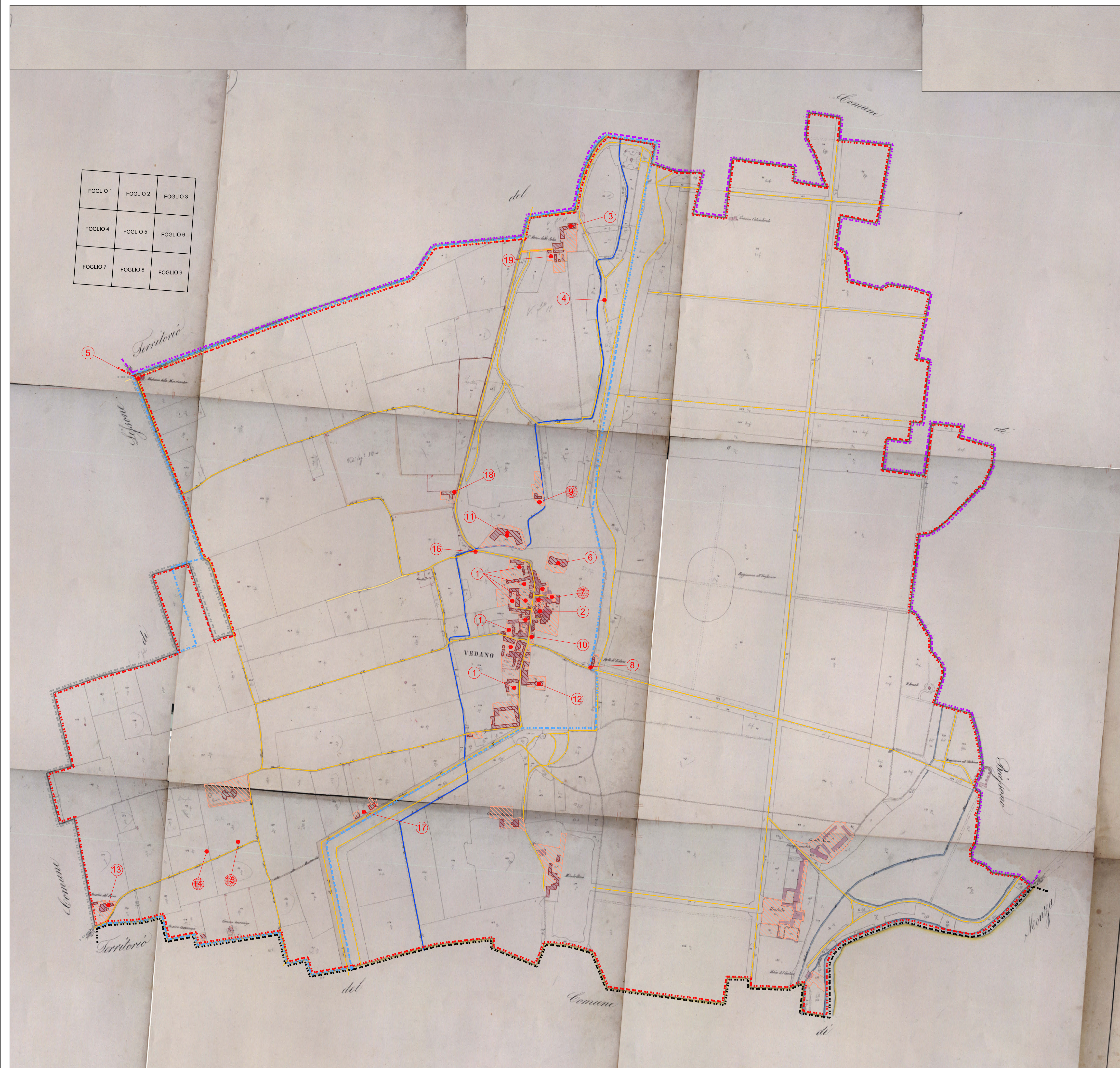
FIG. 1 Comune di Vedano al Lambro, Mappe catastali del 1855 - Unione dei fogli rettangoli