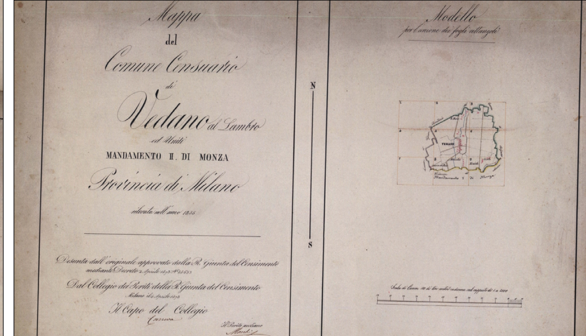
FIG. 4 Comune di Vedano al Lambro, Mappe catastali del 1855 - Modello per l'unione dei fogli rettangoli